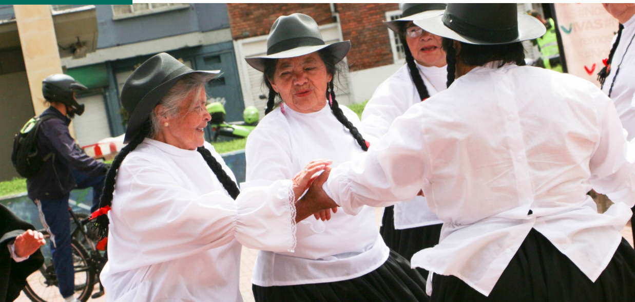
Feria de mujeres emprendedoras, SDMujer, 2017 (en www.flickr.com/photos/sdmujer ).