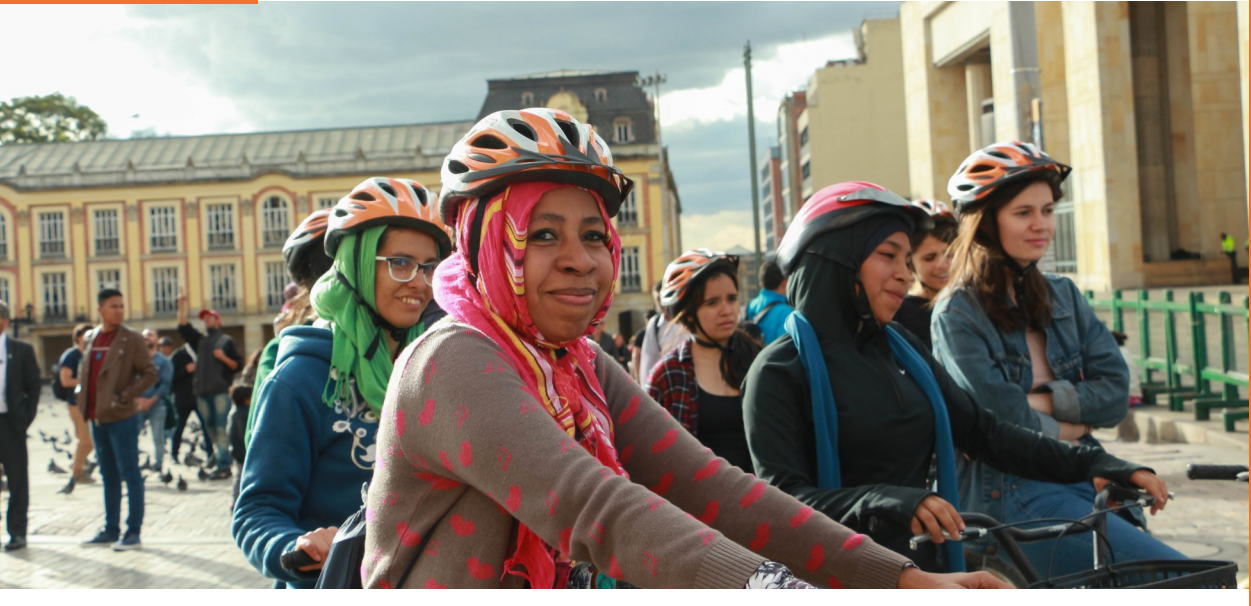
SDMujer, 2018 (en www.flickr.com/photos/sdmujer).