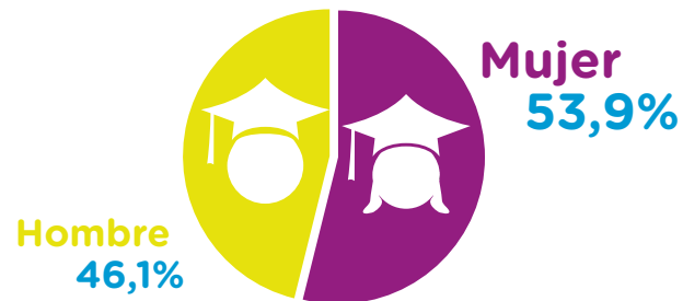
Porcentaje de personas con educación universitaria en Bogotá, según sexo, 2018.

El 53,9% de las personas con educación universitaria en Bogotá son mujeres