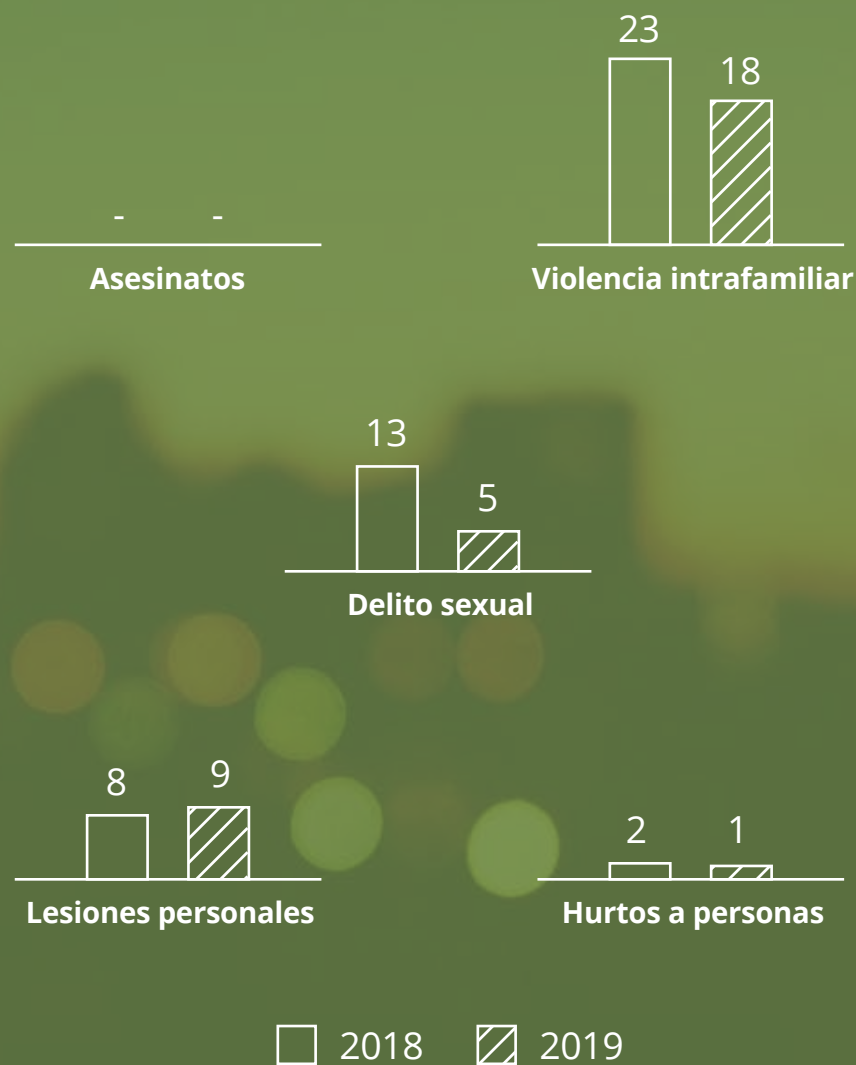
Gráfico 2. Número de casos de delitos de alto impacto contra mujeres según tipo de delito. Localidad de Sumapaz, 2018-2019

Fuente: Oficina de Análisis de Información y Estudios Estratégicos de la Secretaría Distrital de Seguridad, Convivencia y Justicia. Datos extraídos el día 9-03-2020. Cálculos y elaboración del Observatorio de Mujeres y Equidad de Género, OMEG. Información sujeta a cambios.